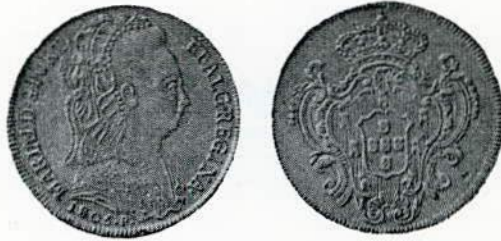
Fig. 85. — 6.400 réis. Peça de quatro escudos.

Peça de 4 escudos . . . . 6.400 réis . . . . ouro c/ toucado.