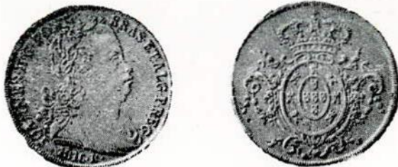
Fig. 101. — Série Especial de 1816. 6.400, ouro — letra monetária R.