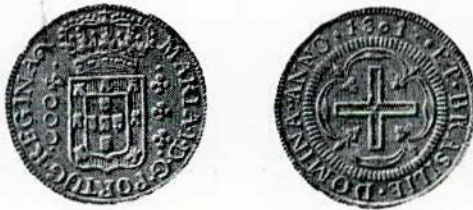
Fig. 86. — Lisboa, Rio e Bahia. 1787 a 1805. 4.000 réis — ouro, sem letra monetária.