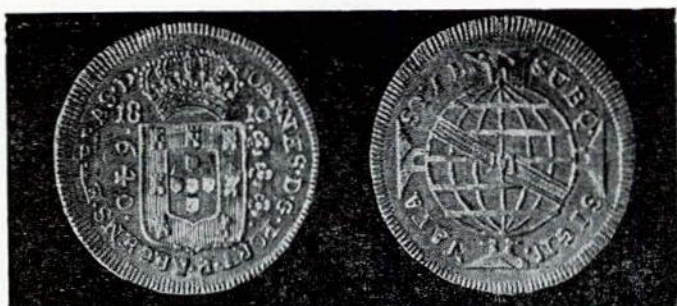
Fig. 95. — 640 réis. Letra monetária B.

Não se conhece exemplar algum de 80 réis.