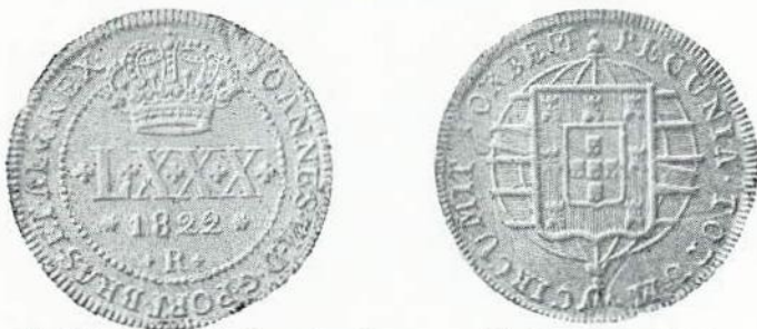
Fig. 110. — LXXX réis, cobre. Letra monetária R. (Sem carimbo).

Nota — De 1819 a 1821 foram cunhadas na Casa da Moeda do Rio de Janeiro, sem letra monetária, para São Tomé e Príncipe, moedas de cobre dos valores de 80, 40 e 20 réis, expressos em algarismos arábicos.