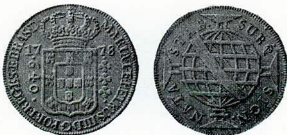
Fig. 82. — 640 réis — prata.

R — Subq. sign. nata. stab. A esfera sôbre a Cruz de Cristo.