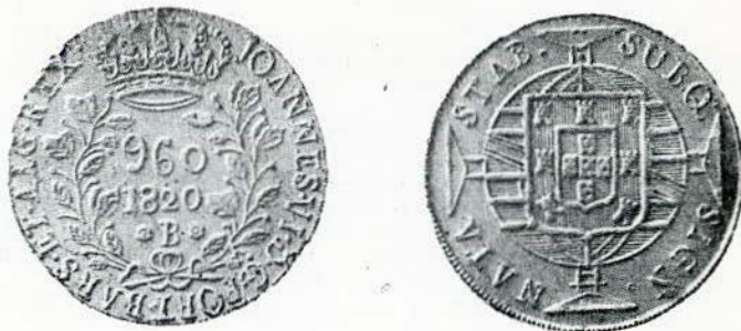
Fig. 111. — 960 réis. Letra monetária B.

A e R — Idênticos aos cunhos da série da Casa da Moeda do Rio de Janeiro, de 1818 a 1822.