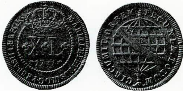
Fig. 83. — X L — cobre.