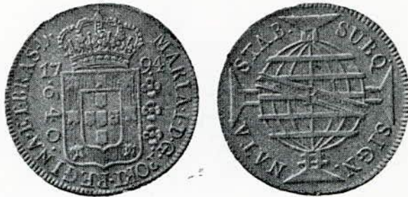
Fig. 89. — Rio de Janeiro, 1789 a 1802. 640 réis — prata.