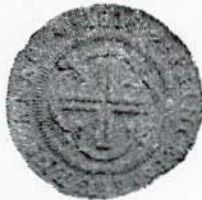
Fig. 102. — Moeda de D. João VI.