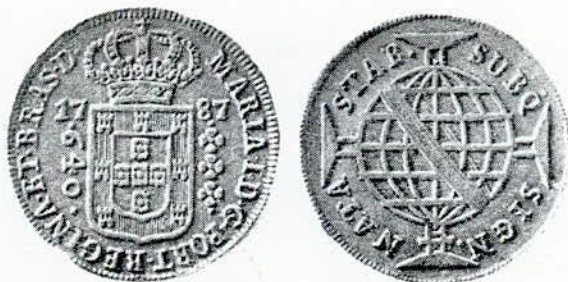
Fig. 87. — Lisboa, 1787 a 1797. 640 réis — prata.