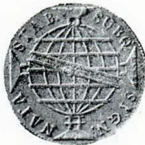
Fig. 103. — 960 réis — letra monetária R.

Casa da Moeda do Rio de Janeiro. letra monetária R.