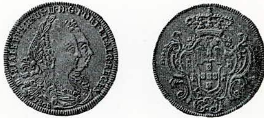
Fig. 80. — 6.400. Peça ou quatro escudos, letra monetária B.

Diferem estas peças das anteriores somente nos bustos conjugados dos monarcas e nas respectivas legendas: Maria. I. et Petrus. III. D. G. P. et. Alg. Reges.