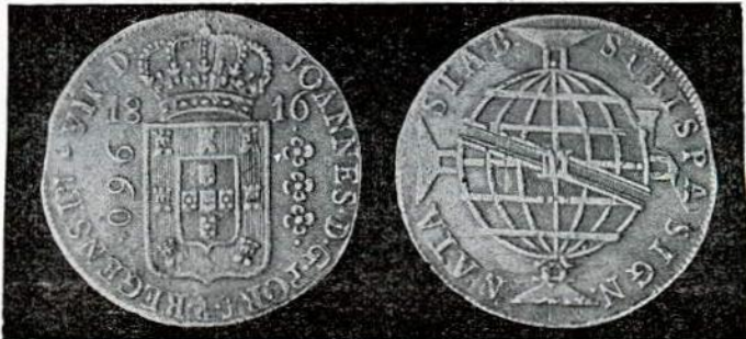
Fig. 98. — 960 réis — letra monetária M.

Recunhos em pesos espanhóis nos 960 réis e em moedas da série J dos 640 réis. Cunhagem geralmente fraca, permanecendo muitos vestígios de cunhos anteriores.