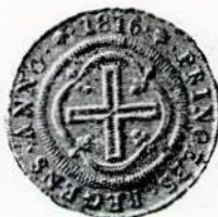
Fig. 94. — 4.000, ouro — sem letra monetária.

Casa da Moeda da Bahia. 1805-1816. letra monetária B.