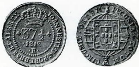
Fig. 114. — 37 1/2 réis, cobre. Com R em vez de M ((provável ençho monetário).

A — Valor entre florões sôbre a data; entre florões no 75 réis e entre pontos no 37 1/2; em baixo a inicial M, circunådado por colar de pérolas não fechado, encimado pela corôa. Legenda: Joannes. VI. D. G. Port. Bras. et. Alg. Rex.