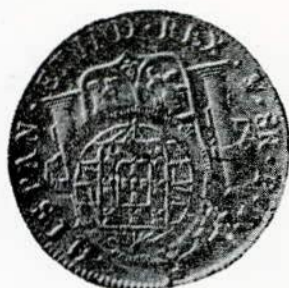
Fig. 117. — Pêso espanhol de Ferdin. VII, de 1820, c/ o C (Cuiabá).