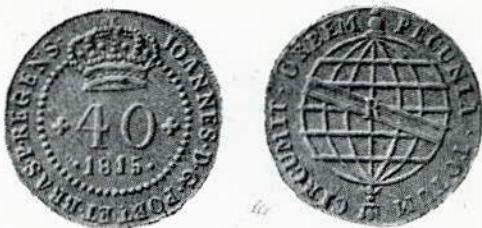
Fig. 105. — 40 réis — letra monetária R.

Rio de Janeiro para Angola. 1814 a 1816.