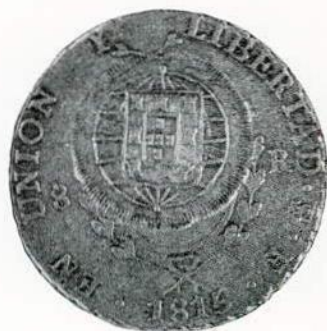
Fig. 118. — Pêso argentino das Provincias del Rio de la Plata de 1815, c/ o C (Cuiabá) (40).