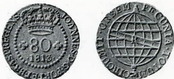
Fig. 104. — 80 réis — letra monetária R.

Rio de Janeiro para Moçambique, São Tomé e Príncipe. 1813 e 1815.