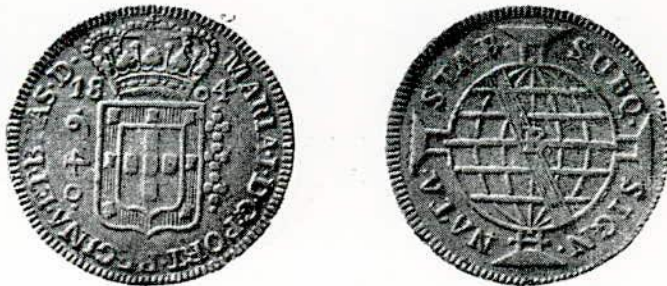
Fig. 90. — Bahia, 1799 a 1805. 640 réis — prata.