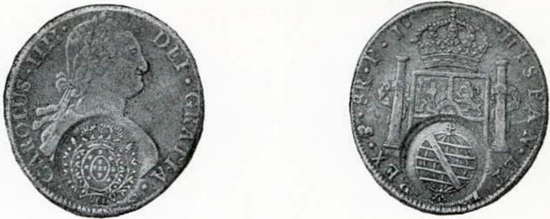
Fig. 97. — Pêso espanhol de Carolus III, recunhado no valor de 960 réis.

A e R — Idênticos aos da Casa da Moeda da Bahia, de 1805 a 1816.