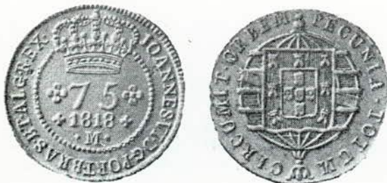
Fig. 113. — 75 réis, cobre. Letra monetária M.