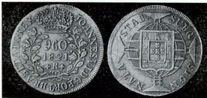
Fig. 109. — 960 réis. Letra monetária R.

A — Joannes. VI. D. G. Port. Bras. et. Alg. Rex. No campo: ao alto a corôa, ao centro o valor e a data e em baixo a letra monetária R entre florões, circundados por dois ramos de carvalho entrelaçados nas hastes.