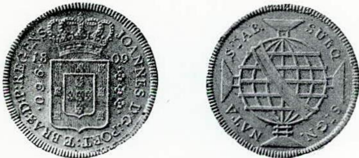
Fig. 93. — Rio de Janeiro. 960 réis — 1809. Ensaio monetário.

O recunho, porém, se estendeu fraudulentamente às peças de 480 réis (cruzado novo) da Metrópole. Essa irregularidade realizada na Casa da Moeda do Rio de Janeiro foi apurada e punida. São muito raros os exemplares recunhados nos cruzados portugueses, principalmente os de 1811.