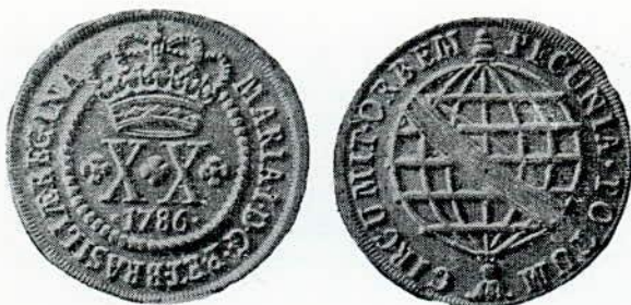
Fig. 88. — Lisboa, 1786 a 1799. X X — cobre.