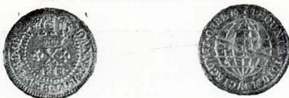
Fig. 96. — X réis — letra monetária B.

A — Joannes. D. G. P. et Brasiliae ou Bras. P. Regens. Valor entre florões sôbre a era entre florões ou pontos deniro de um círculo de pérolas não fechado, encimado pela corôa.