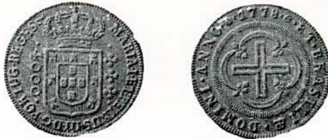
Fig. 81. — Moeda. 4.000 réis. — ouro.