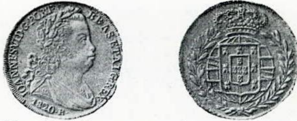
Fig. 107. — 6.400. Peça ou quatro escudos, ouro. Letra monetária R.