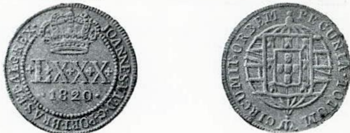
Fig. 115. — Rio de Janeiro, 1820. LXXX réis, cobre. Sem letra monetária.

A e R — Os mesmos das moedas provinciais do mesmo metal.