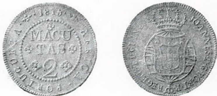
Fig. 106. 2 Macutas — sem letra monetária (39).

Rio de Janeiro para Angola. 1814 a 1816.