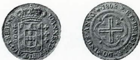
Fig. 92. — Rio de Janeiro, 1805 a 1818. 4.000, ouro — sem letra monetária.

A — Joannes. D. G. Port. et Alg. P. Regens. Armas de Portugal.