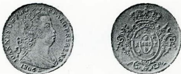
Fig. 91. — Rio de Janeiro, 1805 a 1818. 6.400, ouro — letra monetária R.

A — Joannes D. G. Port. et Alg. P. Regens. Busto do rei à direita e no exergo a data e a marca R (Rio de Janeiro).