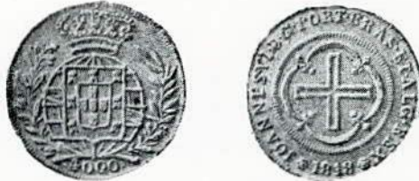
Fig. 108. — 4.000 réis, ouro. Sem letra monetária.

A — Armas do Reino Unido conforme a lei de 13 de maio de 1816. O escudo português no centro da esfera armilar, circundado por dois ramos de louro e carvalho e na junção das hastes, o valor.