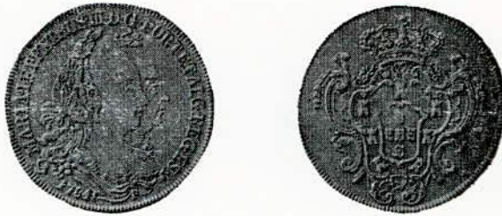
Fig. 79. — 6.400. Peça ou quatro escudos, letra monetária R.