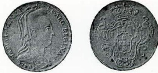
Fig. 84. — 6.400. Peça de quatro escudos, letra monetária R.