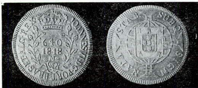
Fig. 112. — 640 réis. Letra monetária M.

A e R — Idênticos aos das séries da Casa da Moeda do Rio de Janeiro, caracterizando-se pela letra monetária M (Minas).