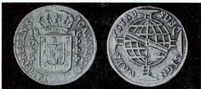
Fig. 99. — 640 réis — Istra monetária M.

REINO UNIDO DE PORTUGAL, BRASIL E ALGARVES. (Regência do Príncipe D. João).