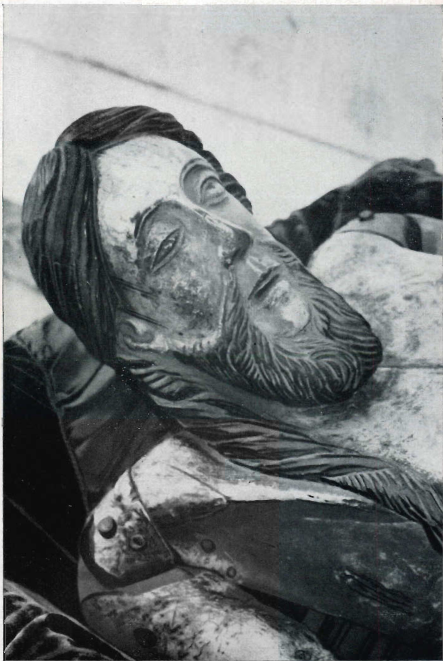
IV. — Pormenor (perfil direito) da imagem jacente do Senhor Bom Jesus, venerada na Basilica de Congonhas do Campo (Brasil).