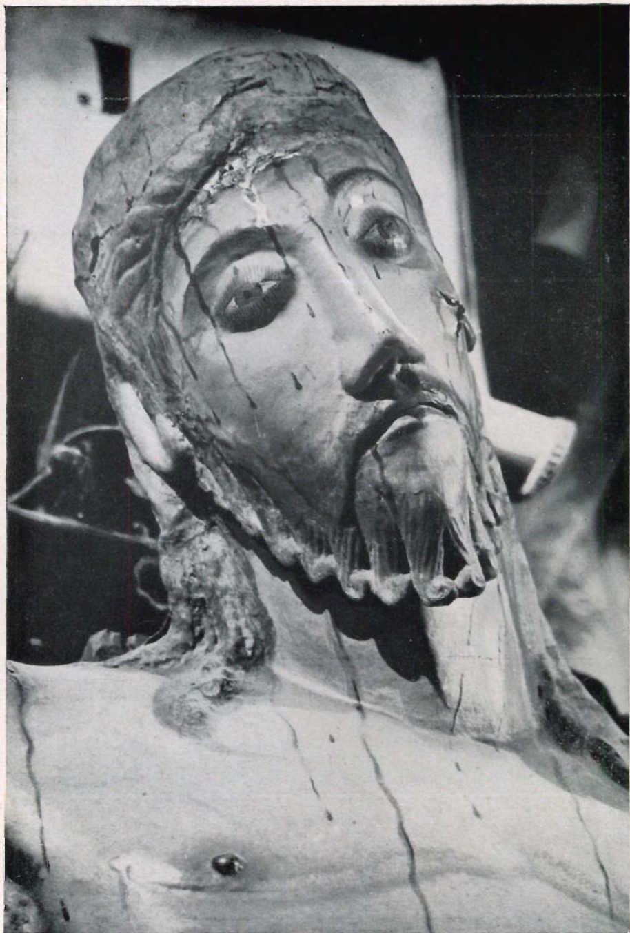
II. — Pormenor da imagem do Senhor Bom Jesus, venerada em Matosinhos (Portugal).