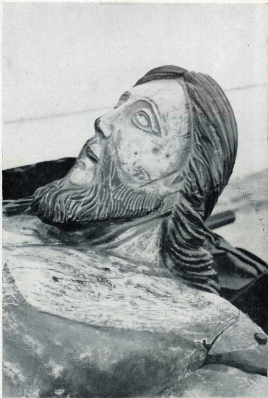
V. — Pormenor (perfil esquerdo) da imagem jacente do Senhor Bom Jesus, venerada na Basílica de Congonhas do Campo (Brasil).