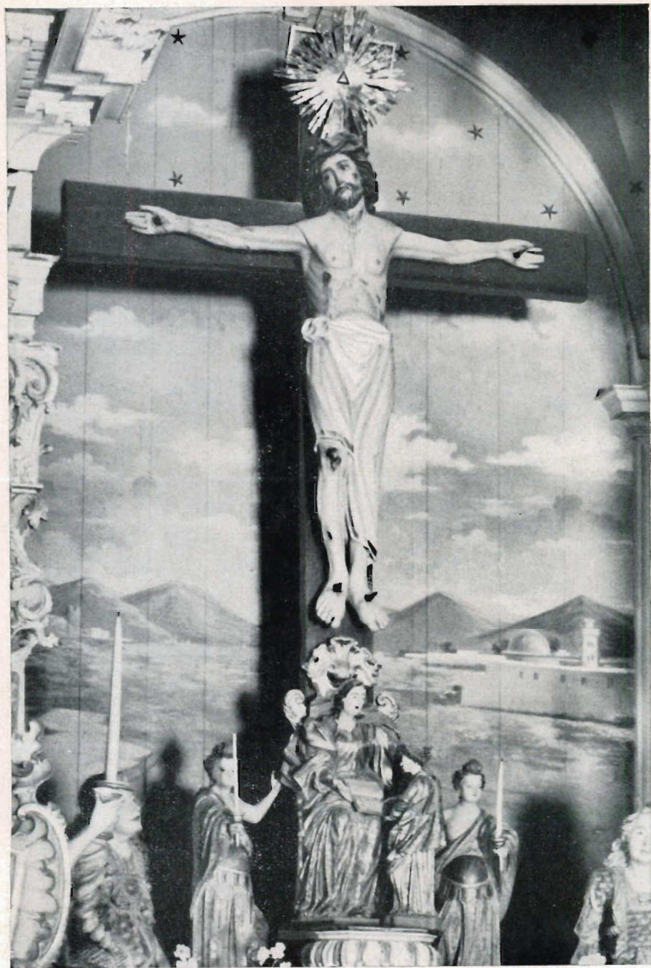
VI. — Imagem do Senhor Bom Jesus (Crucificado) colocada no trono do altar-mor, venerada na Basílica de Congonhas do Campo (Brasil).