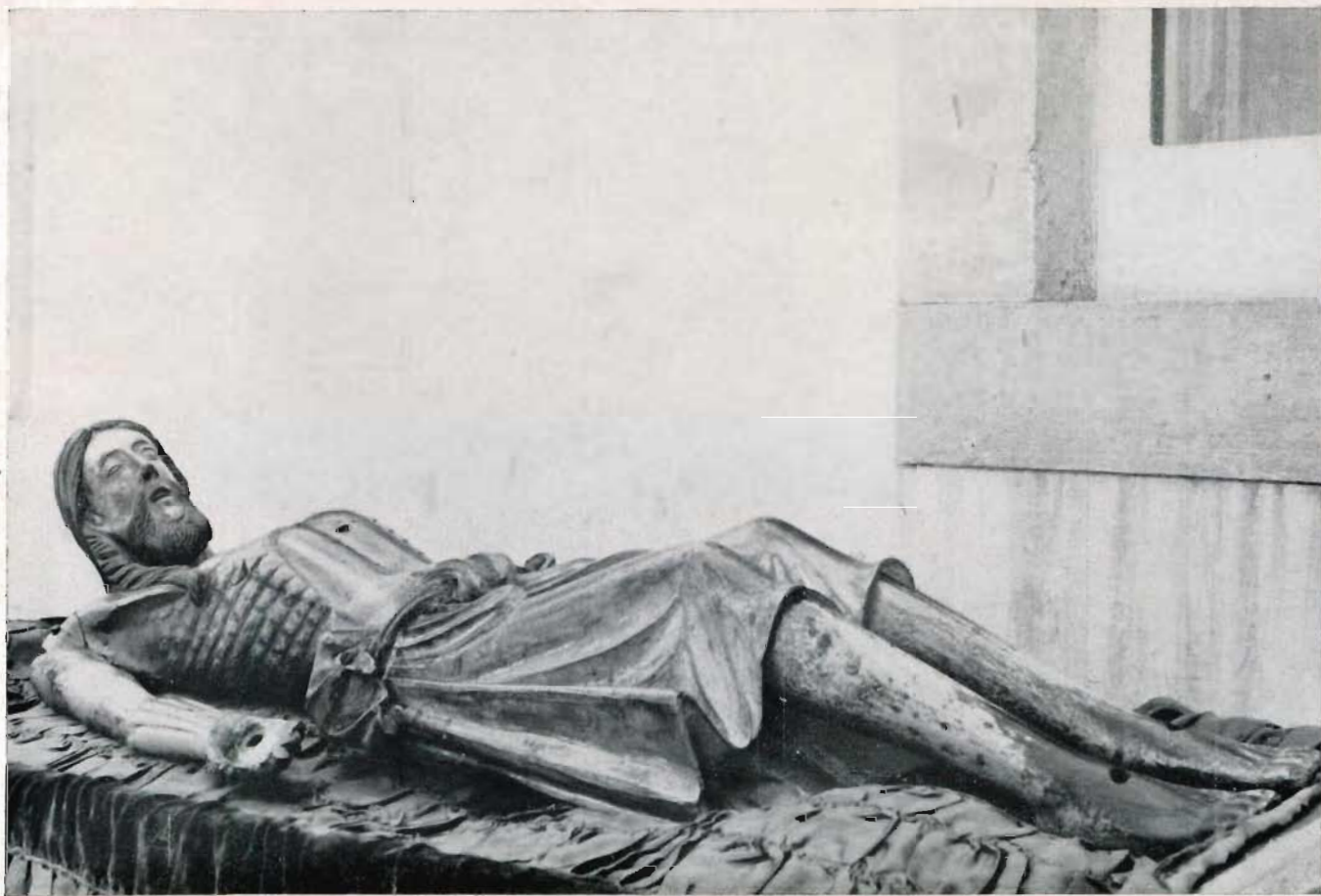
III. — Imagem jacente do Senhor Bom Jesus, venerada na Basílica de Congonhas do Campo (Brasil).