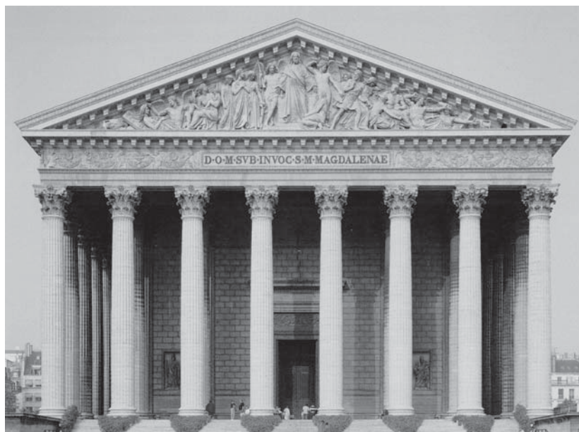
Figura 2: Fachada da Igreja de Madeleine, Vignon (1806)