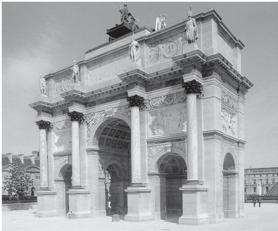
Figura 4: Arco do Triunfo do Carrossel (Paris), Percier e Fontaine (1806-1808)

O primeiro, cuja execução seria coordenada por Denon, espécie de “Ministro das Artes” de Napoleão, foi projetado pela dupla Percier (conhecido por seu compêndio do estilo decorativo do Primeiro Império) e Fontaine (futuro “Primeiro Arquiteto” do imperador). Tratava-se de mais uma parceria bem sucedida que já havia dado certo nos trabalhos de reforma do Louvre e da Malmaison (que havia sido comprada pelo então general Bonaparte e que, depois do divórcio, seria a morada de Josefina).