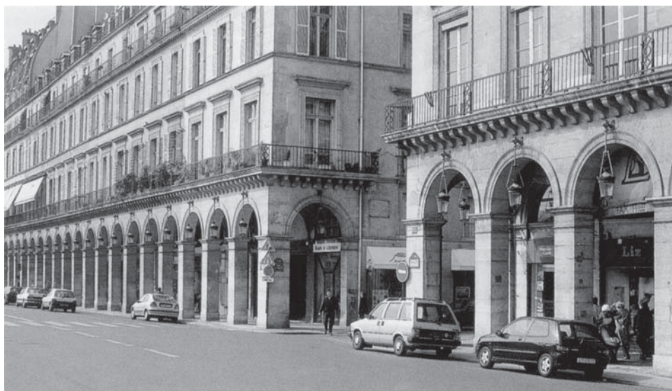
Figura 1: Rua de Rivoli (Paris), Percier e Fontaine (1802-1808)

por Percier e Fontaine face às Tulherias, seria um grande exemplo do emprego do estilo neoclássico na arquitetura: toda debruada de arcadas e casas dispostas uniformemente que espelham, em um certo sentido, o desejo governamental de organização social. Estes são apenas alguns poucos exemplos que não dão conta das numerosas intervenções feitas em Paris.