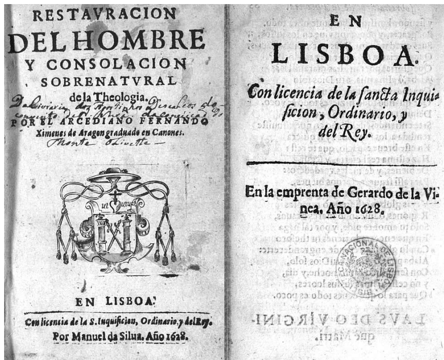
Figura 1 - Exemplar da BNPT da obra Restavracion del hombre .