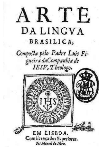
Figura 3 - Exemplar da BNPT da Arte da lingua brasilica .

Há outras particularidades sobre a impressão da Arte . Para se imprimir um livro em Portugal, no século XVII, eram necessárias as licenças do Santo Ofício, do Ordinário e do Desembargo do Paço, os dois primeiros defendendo os interesses de setores da Igreja e o terceiro, do poder civil. Uma publicação dependia, portanto, dessas três licenças, que os tipógrafos da época, para sinalizá-las, colocavam ao pé da folha de rosto “Com todas as licenças necessárias”. Os autores que eram religiosos regulares precisavam receber, ainda, a licença de um superior da ordem ou da congregação. A Arte de Figueira recebeu apenas as “licenças dos superiores”, conforme estampou na página de título, dadas por Manoel Cardoso. Assim, o livro não foi feito e não poderia ser comercializado; não era para o público; não deveria circular fora dos colégios do Brasil. Essa restrição à divulgação do livro teve razões de ordem política e estratégica.