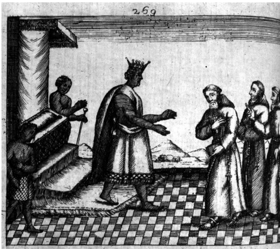
Missão Capuchinha no Reino do Congo, gravura do século XVII. Giovanni Antônio Cavazzi de Montecuccolo, 1687 Descrição histórica dos três Reinos do Congo, Matamba e Angola

Ao contrário de seus antecessores, os papas seiscentistas decidiram trazer as missões ultramarinas para o controle de Roma. Nessa altura, o papado passou a questionar os privilégios por ele mesmo concedidos ao padroado português e ao patronato espanhol por considerá-los então “inconvenientes e subversivos para a autoridade papal”. Praticamente nada pode ser feito contra o patronato dos reis de Castela, respaldado pelo bom êxito da missão na América. Em relação a Portugal, entretanto, enfraquecido após a derrocada de seu monopólio na África e Ásia, em decorrência das investidas vitoriosas de ingleses e holandeses, o papado agiu de forma enérgica.