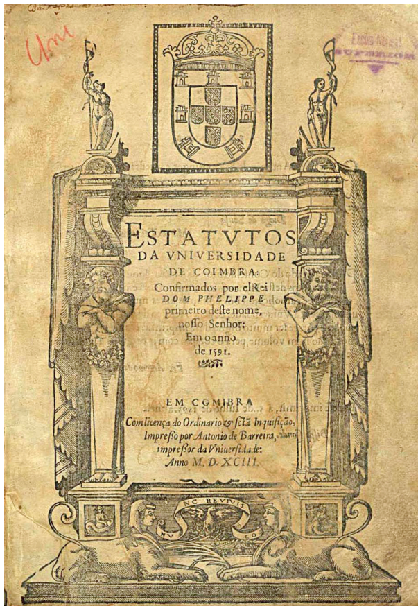
Estatutos da Universidade de Coimbra, 1591. – http://purl.pt/14235/1/index.html#/3/html Impresso por Antonio de Barreira impressor da Universidade, 1593.

No primeiro ano de estudos em Coimbra, Godinho frequentou o curso de Instituta , pré-requisito e, ao mesmo tempo, preparatório para admissão